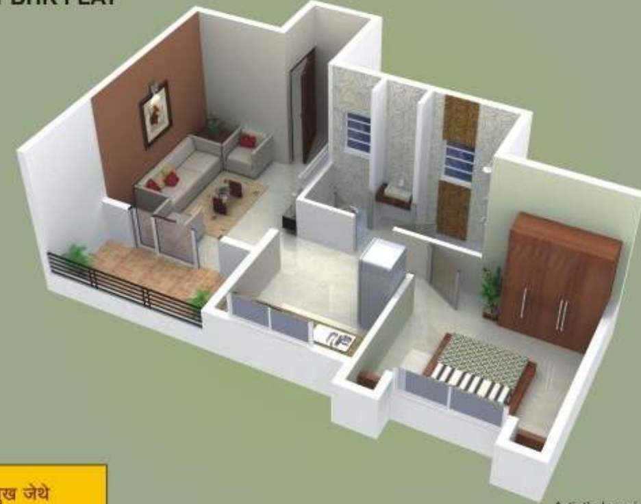
1 BHK FLAT