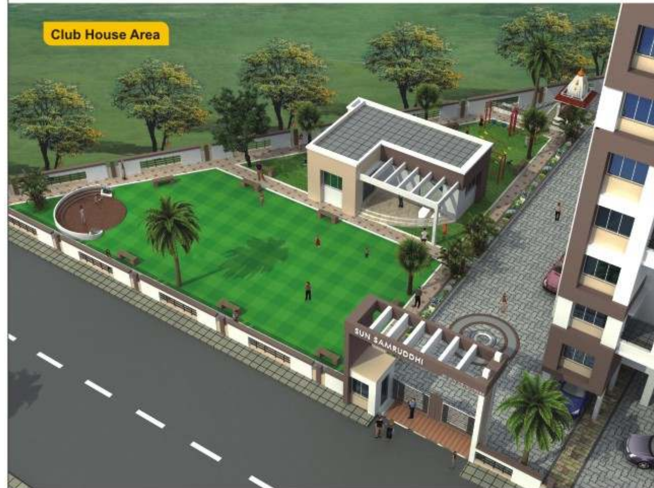
Club House Area